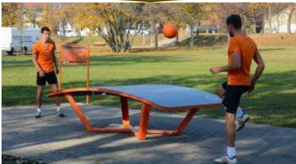
5. Teqball mint sport