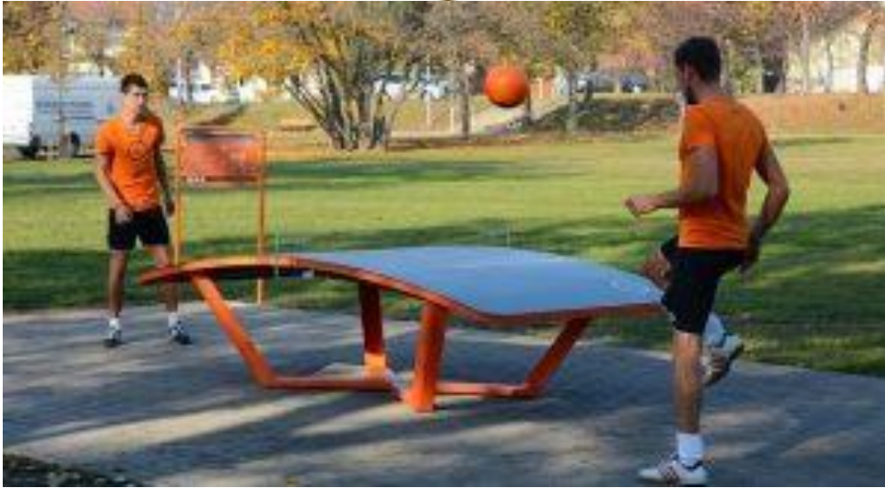
5. Teqball mint sport