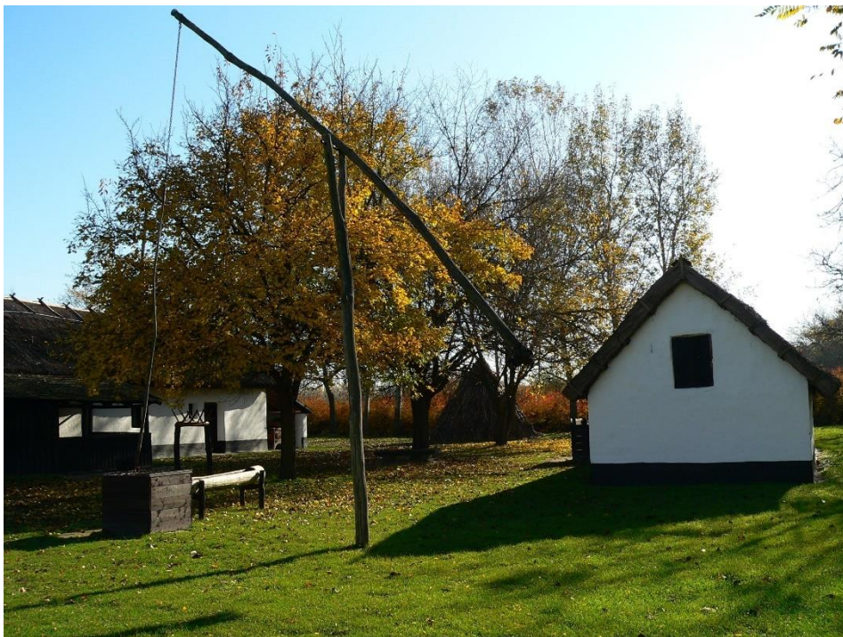
4. a magyar tanya